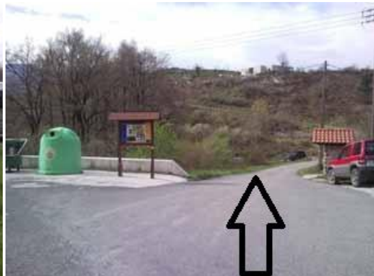
Kortakogain (GI-3591 errepidea/carretera)